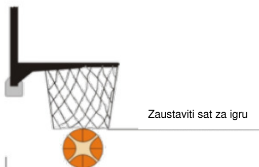
Dijagram 1 . Pogodak je postignut

sat za igru se zaustavlja kada lopta očito prođe kroz koš, kao što je prikazano na Dijagramu 1.