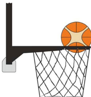
Dijagram 3. Lopta je unutar koša

31-21 Iskaz. Prekršaj ometanja nastaje ako igrač odbrane dodirne loptu dok je ona unutar koša.