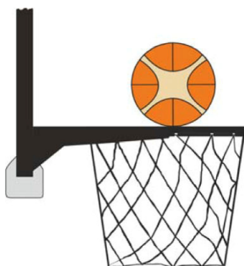
Dijagram 2. Lopta dodiruje obruč

31-15 Iskaz. U toku šuta na koš iz igre, načinjeno je ometanje od strane igrača odbrane ili napada kada igrač dodirne koš ili tablu dok je lopta u dodiru sa obručem i još ima mogućnost da uđe u koš.