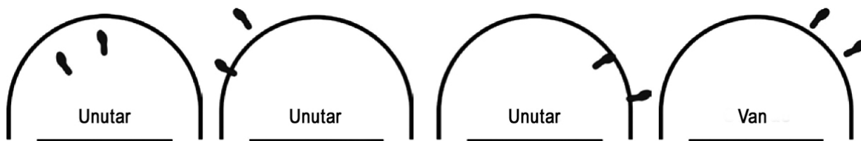
Dijagram 4. Položaj igrača unutar/van polja polukruga bez probijanja

Tumačenje: Pravilna akcija igrača A1. Primenjuje se pravilo o polukrugu bez probijanja.